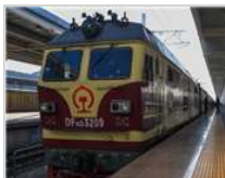
草原上的“便民巴士”