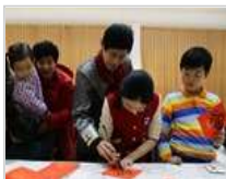
书画艺术家携手志愿者 “迎新春、送文化、走基 层”