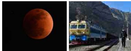
天幕上演月全食美景 华夏