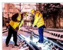
雨雪冰冻中，他们奋力前 行