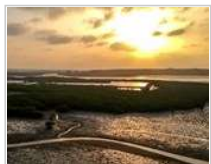
十年树木、红树成林—— “海上森林”回归记