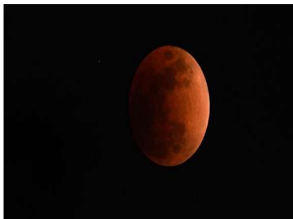
天幕上演月全食美景 华夏共度“红月亮之夜”

最高法决定立案审理吉林“涉黑典型”国家赔偿案 白领辞职回乡办学：一束光就能照亮孩子的前程 小区“大选”：想换物业比美国换个总统都难 科学现场：我的新同事不是人 房子被强拆房价上涨，政府应赔偿还是补偿？ 贫困生补助金睡大觉 良心和责任也在酣睡 日工作10至12个小时 乡镇干部一天工作时间有多长？ 安全局势动荡 阿富汗和平前景更加黯淡 俄罗斯：美国即将公布的“克宫报告”意在干预俄大 强制学生实习 一些职业院校受利益驱使变身“中介”