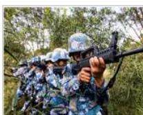
海军陆战队某旅侦察营从 林侦察与反侦察对抗演练