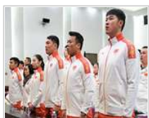
同筑冰雪强国梦——写在 中国冬奥健儿出征前夕