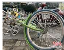
雨后南昌城上演“冰雪奇 缘”