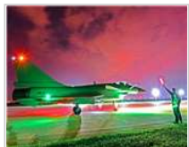
披霞出征 暗夜是战鹰自由 空战的舞台